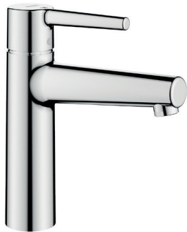
KWC MANA Waschtischmischer

In KWC MANA steckt die ganze Erfahrung und das Know-how aus über 140 Jahren KWC Armaturengeschichte – und der hohe Qualitätsanspruch von KWC.