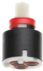
Steuerpatrone M 35 S

Modell-Linie: KIO | 10.481.002.000FL Armaturen | Manuelle Armaturen