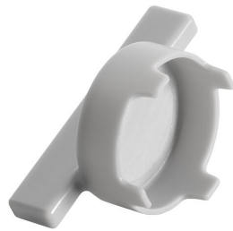
Schlüssel zu KIO Auszugbrause