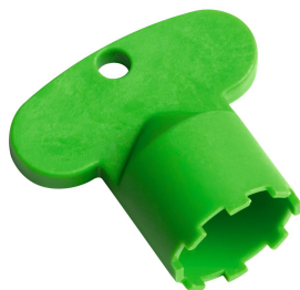
Chiave servizio Neoperl © Caché ©, TJ, 18 mm, verde