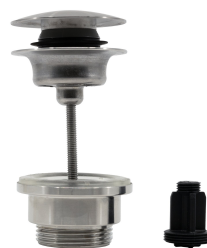
Válvula de vaciado Push Open