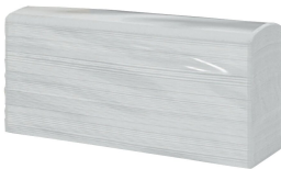
Salviette asciugamani piegate