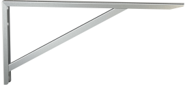
Soporte de sujeción MAXIMA

Modell-Linie: MAXIMA | MAXL227-260 Catering | Lavabos profesionales