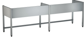
Bastidor MAXIMA para Maxima