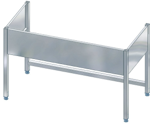
MAXIMA Untergestell zu Maxima