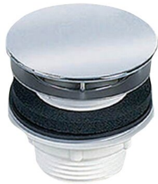
Piletta di scarico pop-up