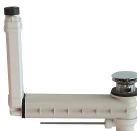
Excentrická odtoková a přeřadovací sada