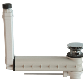
Ab- und Überlaufgarnitur