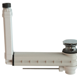
Ab- und Überlaufgarnitur