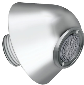
Wylewka ścienna DN 15