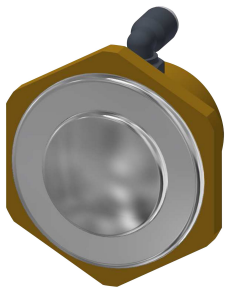
Zawór do armatury spłukującej