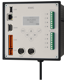
Controlador de función ECC2