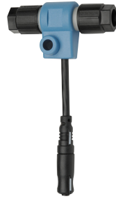
Distribuidor eléctrico en T