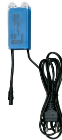
Fuente de alimentación