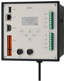
Controlador de función ECC2