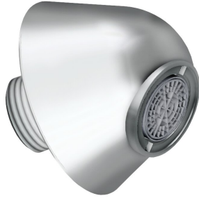
Salida de pared DN 15