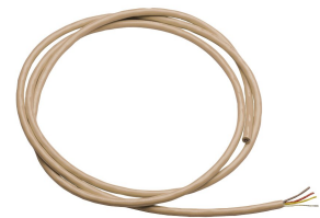
Cable del sistema