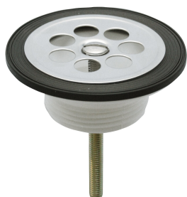
Zawór odpływowy z sitkiem