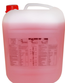
SO10L Flytande tål