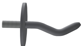
Gancho para colgar