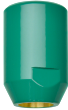
Cabezal de ducha de emergencia