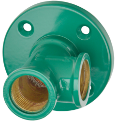
Seinäläpivienti ja kannake hätäsuihkulle