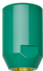
Głowica do natrysków ratunkowych