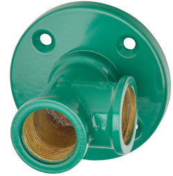
Nooddouchekop met douchearm