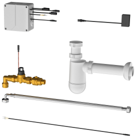
Elektronische Siphonsteuerung für KWC Reihenurinale