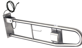
Maniglia ribaltabile a parete CONTINA