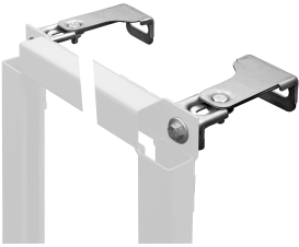
Staffe a parete AQUAFIX