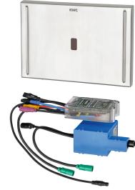
Comando per cassetta WC EXOS.