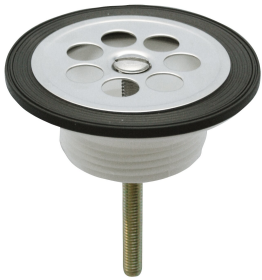
Zawór odpływowy z sitkiem