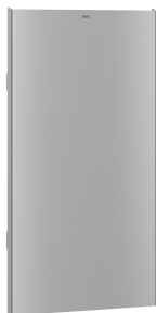
EXOS. Edelstahlfront für EXOS. Abfallbehälter zur Aufputz- und Unterputzmontage

Modell-Linie: EXOS | EXOS605B Accessories | Abfallbehälter