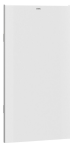
EXOS. Front mit weißem ESG-Glas