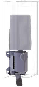
Kit di conversione per distributore di sapone in schiuma EXOS.