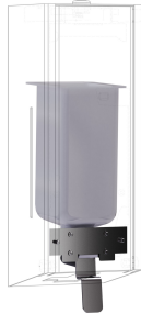
Kit di conversione per distributore di sapone liquido EXOS.