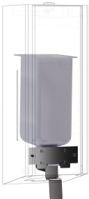
EXOS. Konverteringssats för tvåldispenser för flytande tvål