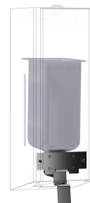
Kit di conversione per distributore di sapone liquido EXOS.