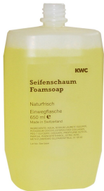
Cartuccia di sapone in schiuma