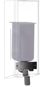
Kit di conversione per distributore di sapone liquido EXOS.