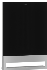
EXOS. Front mit schwarzem ESG-Glas