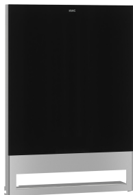
Face avant avec verre trempé noir EXOS.

Accessoires | Distributeurs de serviettes en papier