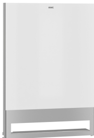
Pannello frontale con vetro ESG bianco EXOS.