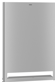
EXOS. Edelstahlfront für Papierhandtuchspender