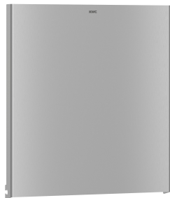
Pannello frontale in acciaio inox EXOS.

Accessori | Distributori di salviette asciugamani