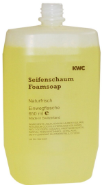
Cartucho de jabón en espuma