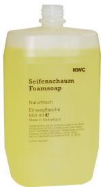
Foam soap cartridge