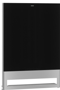
EXOS. Front mit schwarzem ESG-Glas