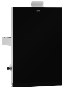
Parte frontal con cristal ESG negro EXOS.