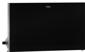
EXOS. Front mit schwarzem ESG-Glas

Modell-Linie: EXOS | EXOS676X Accessories | WC-Rollenhalter