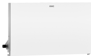
EXOS. front dubbele toiletrolhouder