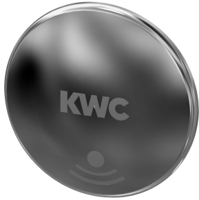
Bouchon de fermeture