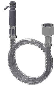
Tuyau de raccordement