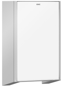
EXOS. Frontabdeckung mit weißem ESG-Glas