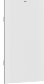
EXOS. Utbytbar frontpanel