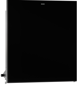
EXOS. Utbytbar frontpanel