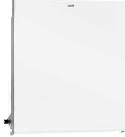
EXOS. Utbytbar frontpanel