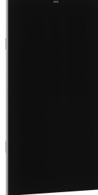
EXOS. Utbytbar frontpanel