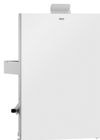
Parte frontal con cristal ESG blanco EXOS.