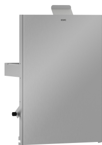
Parte frontal de acero de cromo-níquel EXOS.

Accesorios | Papelera para envases de higiene