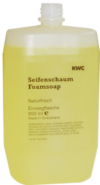
Foam soap cartridge