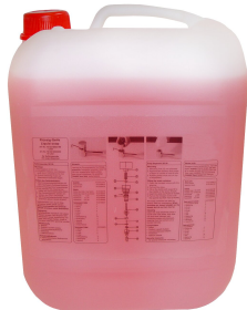
Mydło w płynie