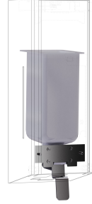
EXOS. Umrüstkit für Flüssigseifenspender