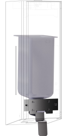
EXOS. Konverteringssats för tvåldispenser för flytande tvål