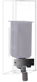
EXOS. Umrüstkit für Flüssigseifenspender