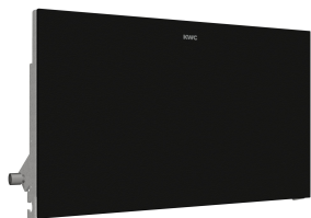
EXOS. front met zwart veiligheidsglas

Modell-Linie: EXOS | EXOS676EX Accessoires | Toiletrolhouders