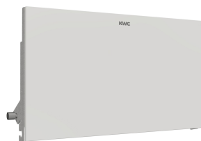
Pannello frontale con vetro ESG bianco EXOS.